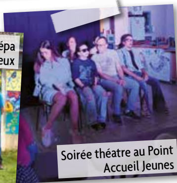
Soirée théâtre au Point Accueil Jeunes