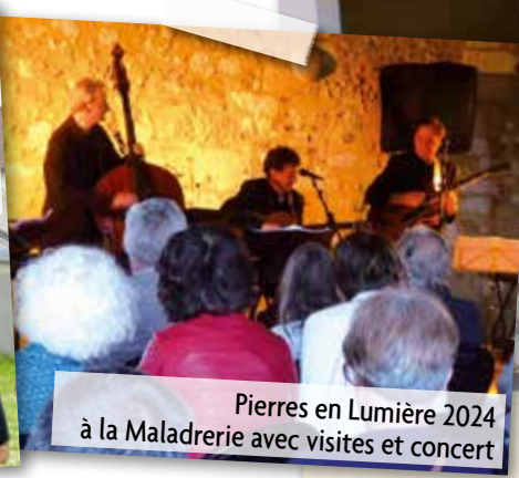
Pierres en Lumière 2024 à la Maladrerie avec visites et concert