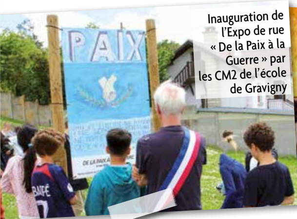
Inauguration de l'Expo de rue « De la Paix à la Guerre » par les CM2 de l'école de Gravigny