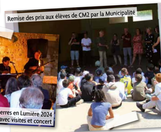
Remise des prix aux élèves de CM2 par la Municipalité