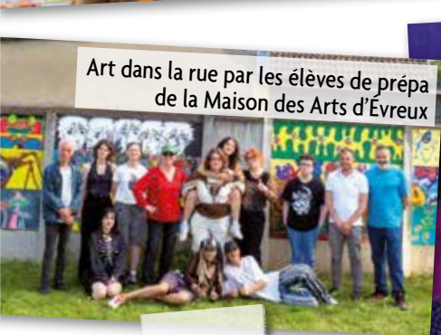
Art dans la rue par les élèves de prépa de la Maison des Arts d'Évreux