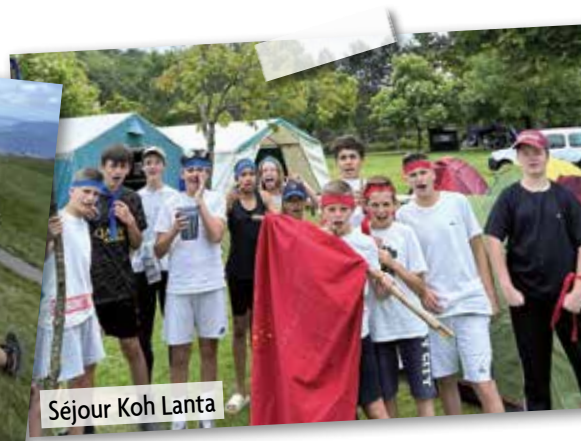
Séjour Koh Lanta