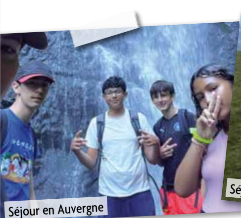
Séjour en Auvergne