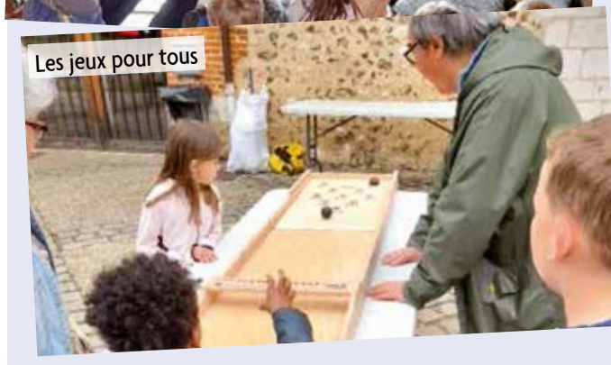
Les jeux pour tous