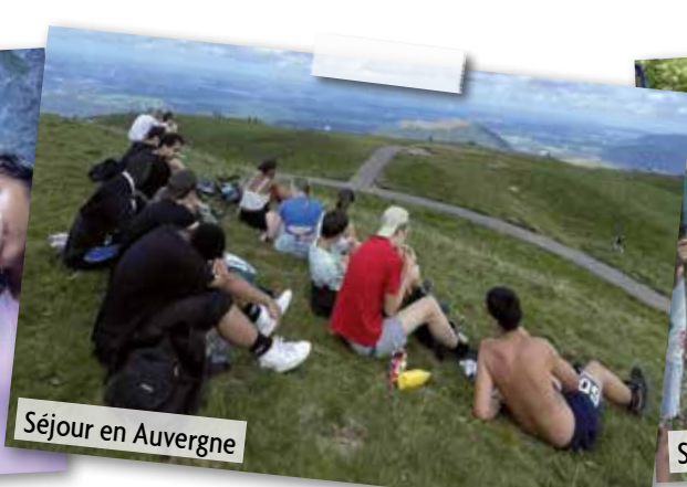
Séjour en Auvergne