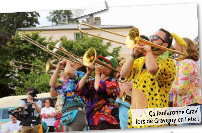
Ça Fanfaronne Grav' lors de Gravigny en Fête !