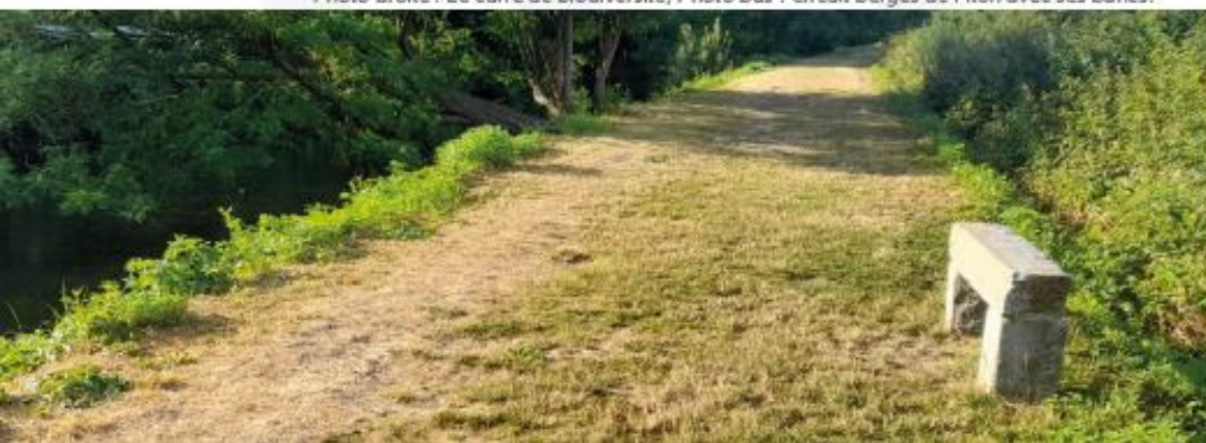
Photo droite : Le carré de biodiversité, Photo bas : Circuit berges de l'Iton avec ses bancs.