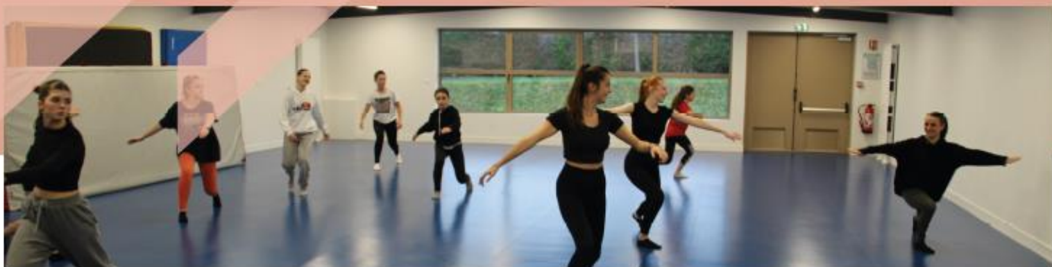
Photo : Extension du complexe sportif club de danse.