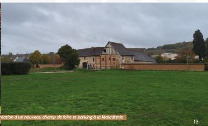
Photo de gauche à droite : Création d'une maison médicale, Création d'un nouveau champ de foire et parking à la Maladrerie.