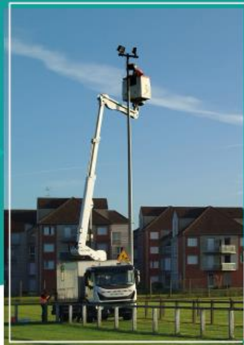
Photo ci-dessus : Passage à l'éclairage LED au stade, photo à gauche : Mât autonome allée de l'école.