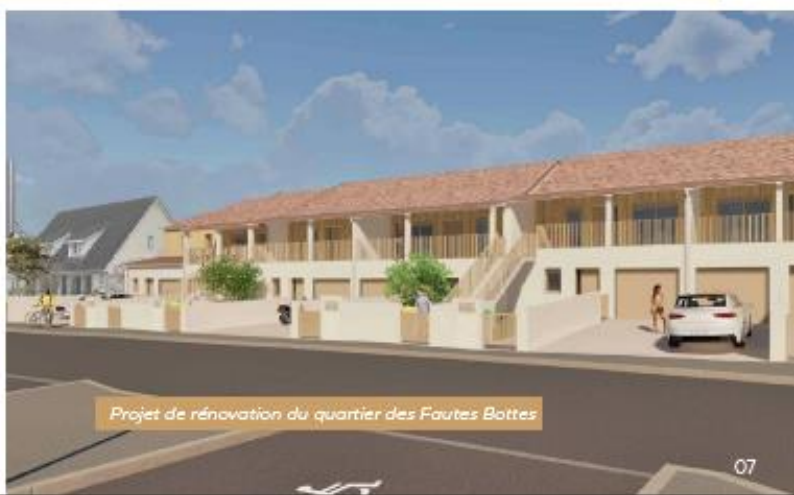
Projet de rénovation du quartier des Fautes Bottes