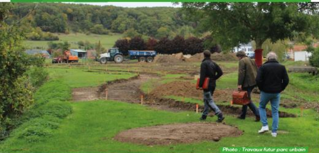
Photo : Travaux futur parc urbain