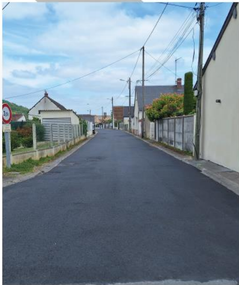
Photo ci-dessus : Réfection rue des Barbançons, Photo ci-dessous : Inauguration classe mobile.