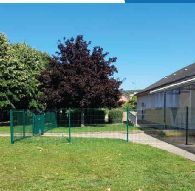
Photo gauche : Sécurisation des accès de l'école Photo droite : Panneau vidéo protection