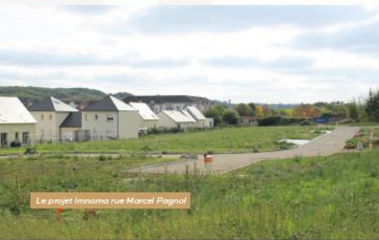
Le projet Imnoma rue Marcel Pagnol